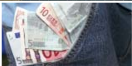
Aufnahme des Gebäudereinigerhandwerks in das Entsendegesetz