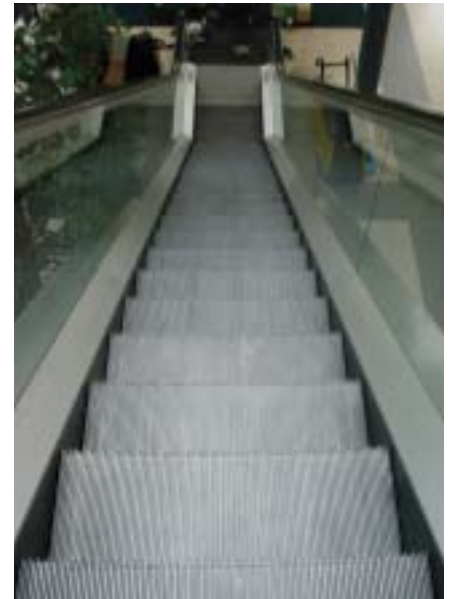
Die Rolltreppe vor und nach der Reinigung durch die Nils Bogdol GmbH

Für Hochglanz bis in die letzte Rille sorgte die anschließende manuelle Reinigung. Nach nur 6 Arbeitsstunden strahlte nicht nur die Treppe, sondern auch der Inhaber des Kaufhauses. Mit diesem glänzenden Ergebnis innerhalb der kurzen Zeit