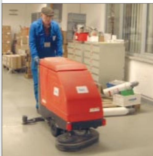
Technik im Einsatz.

öffnet, muss alles blitzblank sein. Der Kunde soll sich schließlich wohl fühlen.