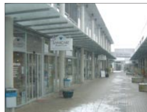
Auch hier gibt's noch Arbeit fürs Team.